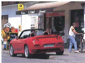
▶テールはサード・ブレイクランプ付き。我々としては、さらにエアロパーツが充実することを望むが……。

▶これは同社として珍しいエアロキット装着のプリント。エンジンとサスペンションのチューンでやってきた同社だが、'96年、一連のエクステリアパーツも開発するようになっていく。