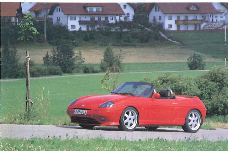
▲ニュルブルクリンクでテストしていたそうで、少し荒れていたバルケッタ。こうしてテストを繰り返すのもTUVの基準をクリアするため。だから、ドイツのチューナーものは、信頼性が高いのだ。

ったのかもしれないが、乗り心地には滑らかさといったものが感じられ、チンクエチエント特有のピッチングの気配も無い。ノンパワーのステアリングは相変わらずスローだが、回頭性はノーマル以上。といって太いタイヤが路面に影響されて、チヨロチヨロするようなこともない。上出来なのである。 ということで、リポーターは数分もすると、今度はギースル氏同様、スロットルを目いっぱい踏みようになっていた。それで分かったのは、ターボのブースト効果が出て盛り上がるトルクを感じられるのは、3500rpmあたりから。トルク感を維持したまま、タコメータの針はレッドゾーンの始まる6000rpmを超えて、7000rpmに近づく。まるで小排気量であることを意識させない、めざましい加速！アウトバーンでスロットルを床に踏みつけたままにしておくと、やがてスピードメーターの針は180km/hでも超えた！ エキゾーストノットは、フシューという低めの音、スロットルを全開にすると、たちまちビジュッと、ウエストゲートが開いてエアを逃がす音が聞こえる。ともあれ、とんでもないチンクエチエント・スポーティングだ。0~100km/h加速は7秒9、最高速は188km/hとなっているのである。 思わず知らず、最もインパクトの強かったチンクエチエント・スポーティングの話が長くなってしまったが、バルケッタ、145の印象を手短にお伝えしておく――。 チンクエチエントと同じ手法で仕上げられたバルケッタは、スポーツ走行といった場合、シャシーバランスのよさが感じられて、実に気持ちよく楽しいハンドリングでもあったが、一旦タウンスピードになると、乗り心地の悪さが露呈。上体は常に揺られ、オープンボディの緩さも感じられるようになった。 これはどうやら、少し前までニュルブ