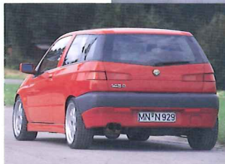
▲タイヤが太く見えるが、そのはずで、215/40R17。ホイールは7.5J×17(ET30)。これも76φツインのDTMタイプ・マフラーを装着。