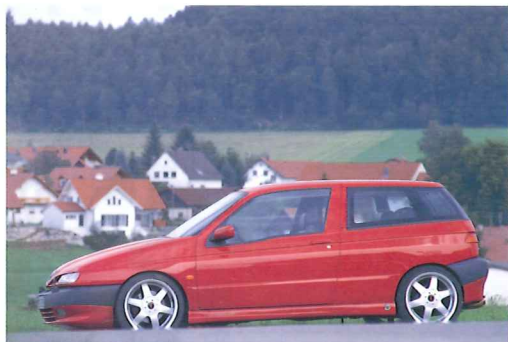
▼試乗車のエンジンは、208ps仕様。0~100km/hが6秒6、最高速247km/hというパフォーマンスデータを叩き出している。

▶ドイツでも人気があるというアルファ145のチューニングプログラムにも、ターボを用意しており、145唯一のターボキットとしてヨーロッパ各国から注目されているという。アルファでなくする気がないが……。